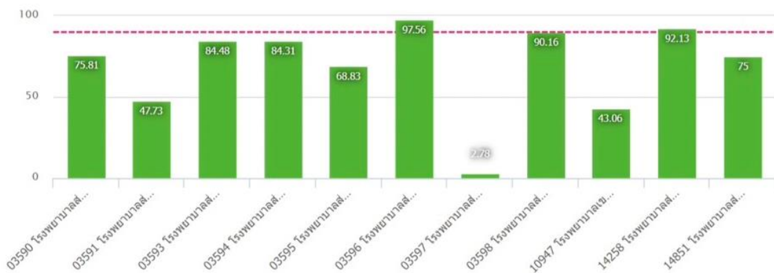
ความครอบคลุมการได้รับวัคซีนแต่ละชนิดครบตามเกณฑ์ในเด็กอายุครบ 5 ปี (fully immunized) เขตสุขภาพที่ 10 จังหวัดอุบลราชธานี อำเภอเขมราฐ ปี 2566