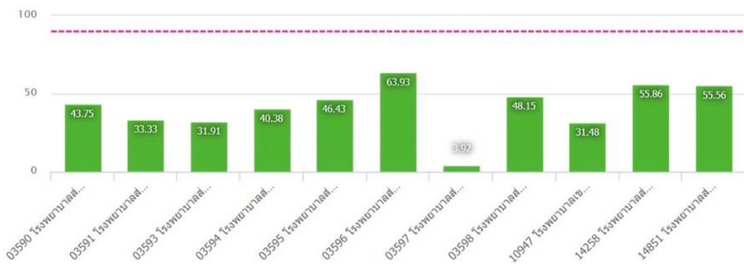
ความครอบคลุมการได้รับวัคซีนแต่ละชนิดครบตามเกณฑ์ในเด็กอายุครบ 3 ปี (fully immunized) เขตสุขภาพที่ 10 จังหวัดอุบลราชธานี อำเภอเขมราฐ ปี 2566