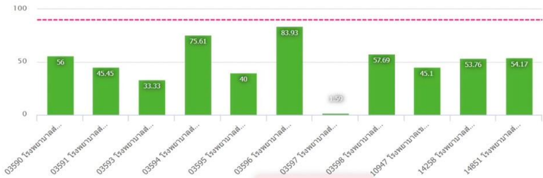
ความครอบคลุมการได้รับวัคซีนแต่ละชนิดครบตามเกณฑ์ในเด็กอายุครบ 2 ปี (fully immunized) เขตสุขภาพที่ 10 จังหวัดอุบลราชธานี อำเภอเขมราฐ ปี 2566